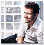
Pablo Alborán Pablo Alborán